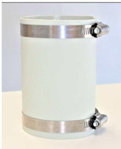
①-A タイプ (リングなし×バンド止め)