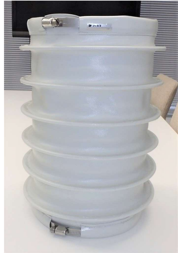
[ ※補強リング周りは縫製します ]