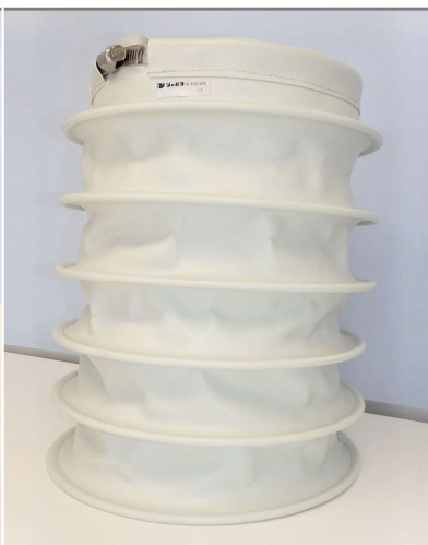
②-A タイプ (リングあり×バンド止め)