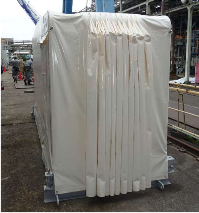
縮めた状態 搬送用架台に乗せてあり、このまま吊れます