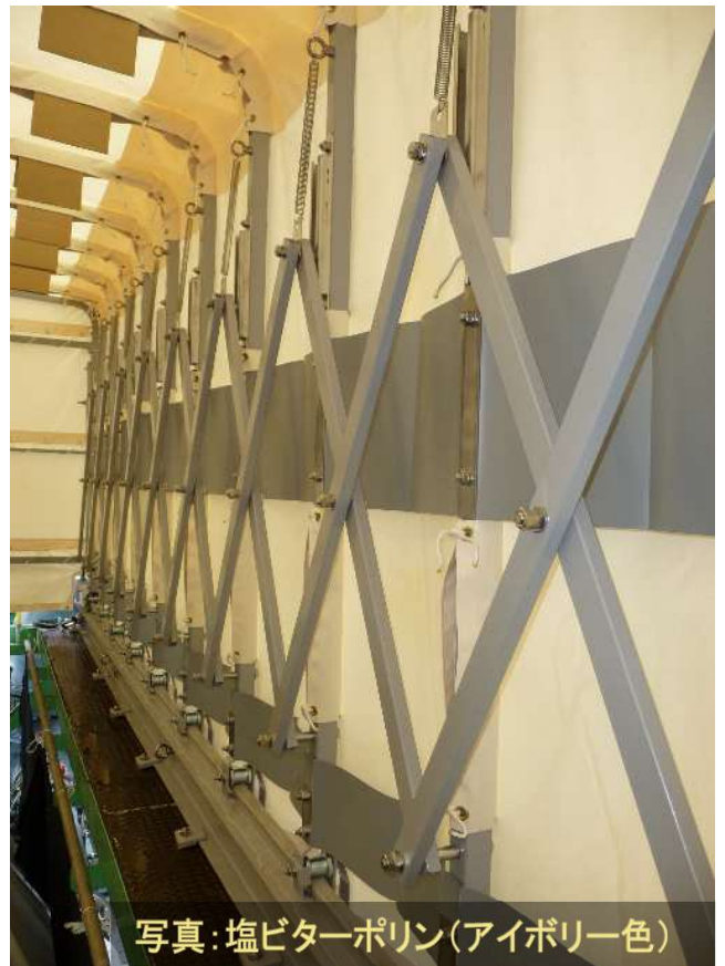
開閉機構はスプリングパンタグラフ式 シートは耐候性のある素材を採用！ 軽いため、手動で楽々開閉が可能です