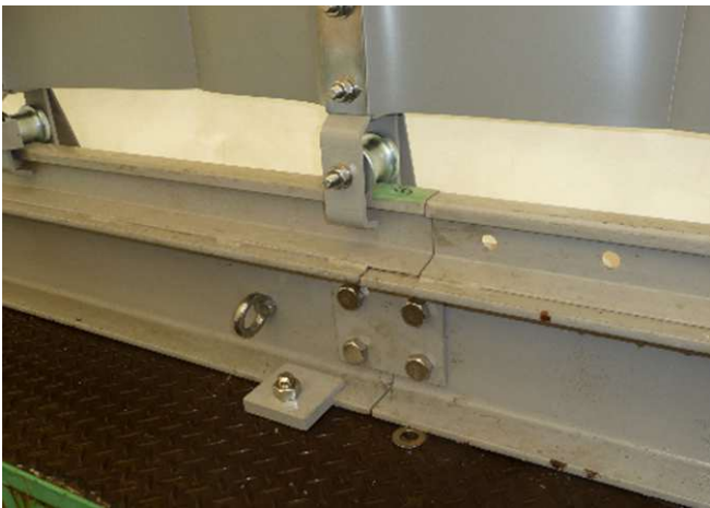
大・小レール連結部とベアリング車輪