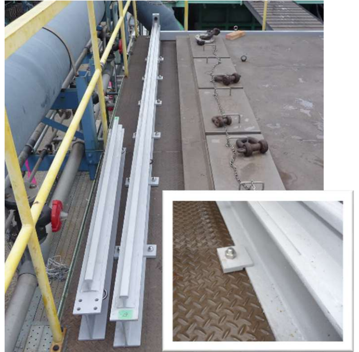
レールは固定ブラケットをボルトで固定 * 基礎工事はお客様施工となります